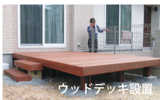
ウッドデッキ設置

「110 番」の 29 年末までの依頼件数は 407 件です。その内の多いのは「剪定・草刈り」で 140 件です。「草刈・剪定」は個人宅もありますが、団地等の自治会からの依頼が多数あります。次に多いのは「家財の引取処分」で 74 件です。高齢者の方々が施設に入ったり、子供と同居するために引越させられたりします。そのため、その家の中の一式の処分(家具の処分からクーラーの取り外し等)となります。県住・市住に防犯カメラ設置工事お住まいの場合は返還の最終確認立合いまでさせて頂いております。この様に、地域の方々のちょっとした困りごとにも対応し、評価を頂いております。