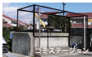
ゴミステーション