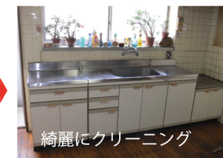
綺麗にクリーニング