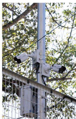
防犯カメラ設置工事

「110 番」の 29 年末までの依頼件数は 407 件です。その内の多いのは「剪定・草刈り」で 140 件です。「草刈・剪定」は個人宅もありますが、団地等の自治会からの依頼が多数あります。次に多いのは「家財の引取処分」で 74 件です。高齢者の方々が施設に入ったり、子供と同居するために引越させられたりします。そのため、その家の中の一式の処分(家具の処分からクーラーの取り外し等)となります。県住・市住に防犯カメラ設置工事お住まいの場合は返還の最終確認立合いまでさせて頂いております。この様に、地域の方々のちょっとした困りごとにも対応し、評価を頂いております。