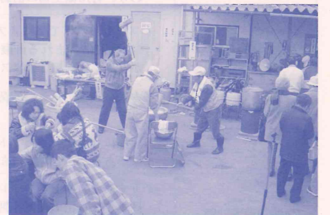
12月~1月のリサイクルバザーでは餅つき大会も実施しています。