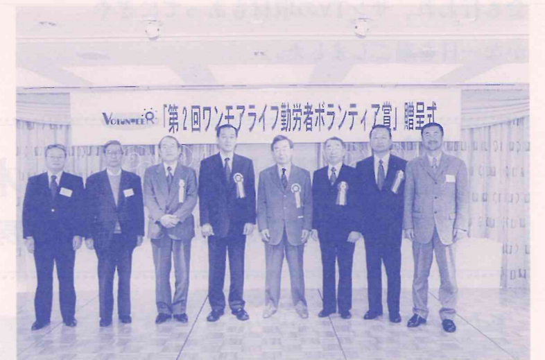
ボランティア賞・ナイスアシスト賞、兵庫県受賞者全員写真