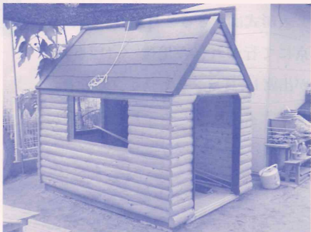
伊丹市「クレヨン保育園」に設置されているこもれび工房 製作ミニログハウス(遊具)

私たちの名谷事務所の構内にあります「こもれび工房」では、檜の間伐材を活用した木工製品を注文に応じて製作しており大変好評をいただいております。ミニログ材の犬小屋、プランターをはじめ、机、椅子などの注文も多く、忙しい毎日です。ある幼稚園からミニログハウス(子供の遊具)の製作依頼があり(写真)、子供さんたちに喜んでもらっています。