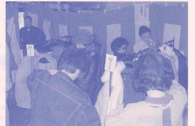
毎月のバザーには沢山の人が参加されます。