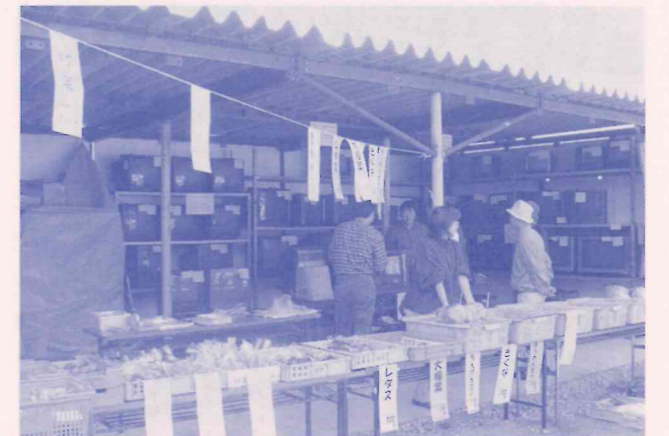
地元の農家で作った新鮮な野菜も販売しています。

私たちは、日常「リサイクル活動」で集めた物品を修理整備して必要な方に安く提供していますが、皆さんに広く知っていただくために、毎月1回(最終土曜日に)、名谷事務所の構内で『リサイクルバザー』を計画し好評をいただいています。当日は模擬店(おでん、焼きそば、コーヒーなど)もあり、新鮮な野菜の販売などもあって賑わいます。みなさん、ぜひお出かけください。12月と1月は餅つき大会も行いました。