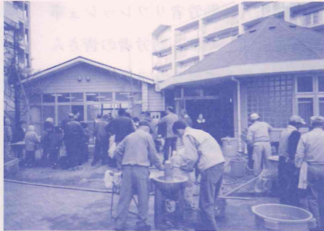
ルゼフィール集会所前での餅つき大会

さる12月26日(金)、名谷駅東側の「ルゼフィール集会所前の広場」で年末の餅つき大会が行われ、多くの人出で賑わいました。この餅つき大会は地域の「中落合なでしこ会」や「中落合1-2クラブ」の皆さんと一緒に私たちが協力して実施したもので、このほか「花谷ふれあいまちづくり協議会」「太極拳同好会」「カラオケ同好会」「グランドゴルフ同好会」などの皆さんからも協力していただきました。つきたてのお餅の即売会も行われ、サンTVの取材もあってにぎやかな一日を過ごしました。