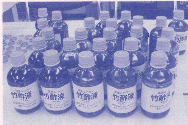
昨年春頃から製造をはじめた竹炭からとれた「竹酢液」が静置期間を経て、ようやく製品になりました。

先に、この会報(12月1日号)でお知らせしましたとおり、昨年春ころから「竹炭」の製造・販売を始めておりますが、竹炭製造の過程で抽出される『竹炭液』は、不純物を除去するため長期間「静置」する必要があります。ようやく6ヶ月ほどの期間を経て製品化することができましたので、1月の「リサイクルバザー」から販売を始めました。ご利用ください。