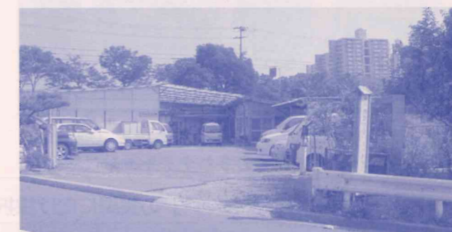
写真は名谷事務所正面

設立当初は、「被災者仮設住宅居住者の生活支援」を主な業務としてきましたが、復興住宅の建設に伴って、地域の「高齢者や